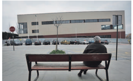
La parte exterior del complejo ya está finalizada.

El nuevo equipamiento deportivo del Castrillón, con más de 3.000 metros cuadrados útiles, dispondrá de una piscina con cuatro calles, pista polideportiva con una grada para cien personas, zona termal con múltiples duchas y spa, y cuatro salas de distinto tamaño para practicar actividades dirigidas, además de vestuarios y un aparcamiento público para los socios con más de cien plazas. Entre las clases a las que se podrá asistir habrá bike , bike xpress , body pump , body combat , body balance , GAP , pilates , step , aeróbic , fitness infan-