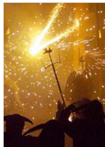
Una maça d'una colla de diables ■ JOSEP MEDINA

Per contra, l'avi del menor va relatar que el nen era davant seu en una cantonada del balcó —en un primer pis— i amb el cap amorrat entre les baranes. Va assegurar que tiraven aigua als joves que participaven en el correfoc i que els ho demanaven —com és habitual—, i en arribar els diables, aquests van dir-los que pareessin. "Un dels diables va encendre una maça i es va posar a la vorera i a sota del nos-