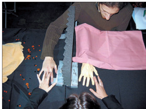
►► La il·lusió del braç de goma en l'experiment ¿Es este mi brazo?

►► Razzmatazz. Pamplona, 88. De 18.00 a 0.00 hores. Gratuït. Només per a més grans de 16 anys.