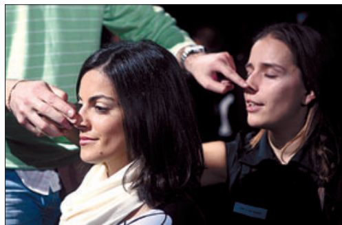
►► Un investigador i dues voluntàries a La nariz de Pinocho .