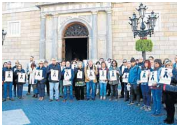
Els concentrats mostren papers amb un crespó negre en l'acte d'ahir a la plaça de Sant Jaume de Barcelona